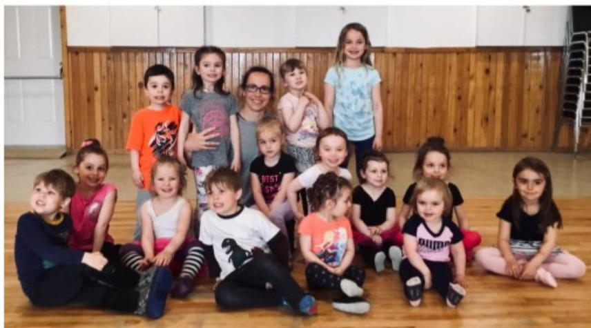
Cours Éveil à la danse (2-5 ans)